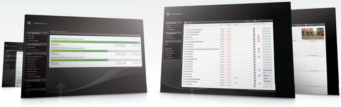
Brugervenlig backend hvor du kan administrere alle videoklip